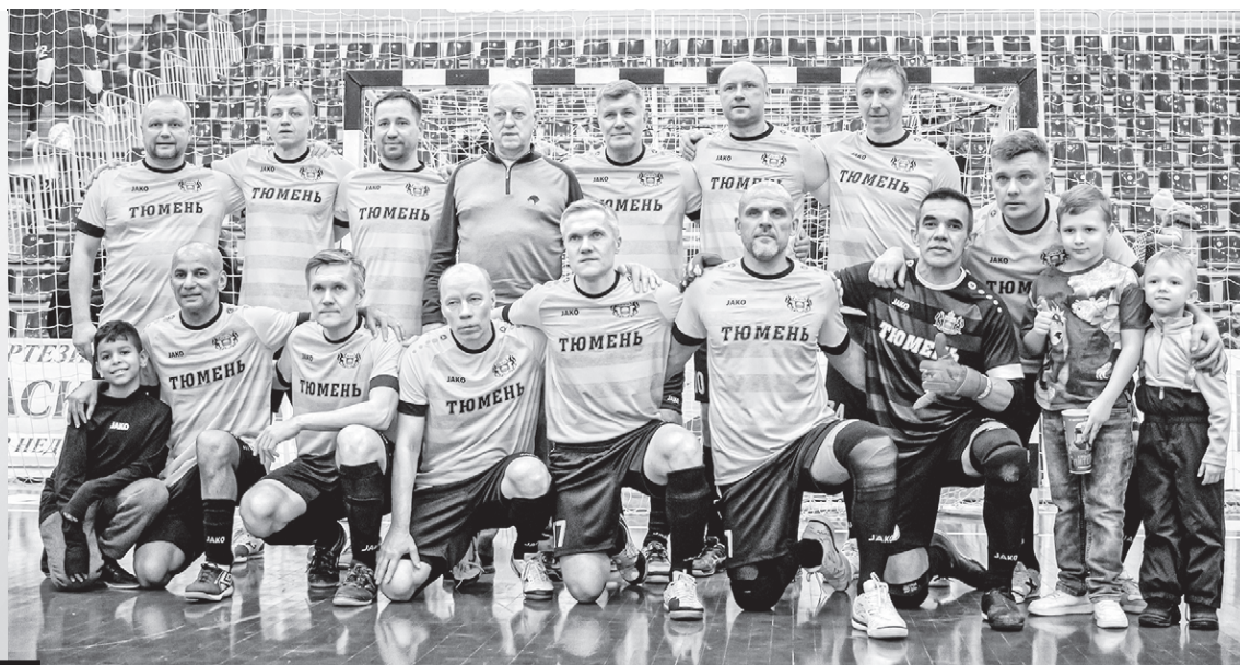
Сборная легенд Тюменской области