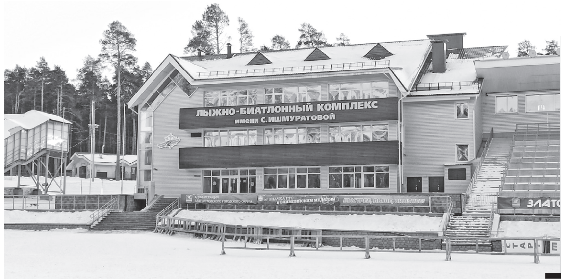
Лыжно-биатлонный комплекс имени Светланы Ишмуратовой

Помните, Владимир Высоцкий пел, что лучше гор могут быть только горы, на которых ещё не бывал. Так вот биатлонисты, болельщики, журналисты со всей страны последуют завету Владимира Семёновича и посетят великий Южный Урал. А точнее — Златоуст, город со сказочным названием, окружённый могучими хребтами Таганая.