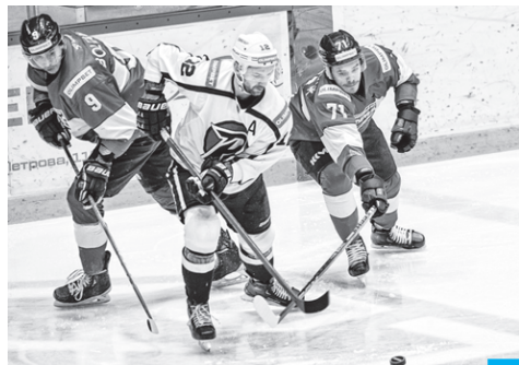
Фрагмент матча «Зауралье» — «Рубин»